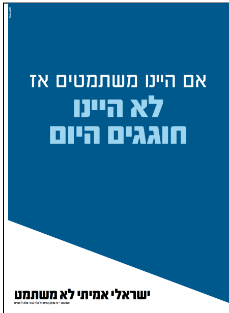
פורסם ביום העצמאות